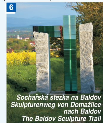
Sochařská stezka na Baldov Skulpturenweg von Domažlice nach Baldov The Baldov Sculpture Trail

6 Sochařská stezka na Baldov (2 km) - galerie soch v přírodě připomíná dějiny města Domažlice kolem roku 1431, kdy došlo k vítězné bitvě husitů nad křižáky. Stezka měří 1,2 km a začátek je za Domažlicemi, rozcestí U Tří vrb, směr Luženičky (zelená turistická značka).