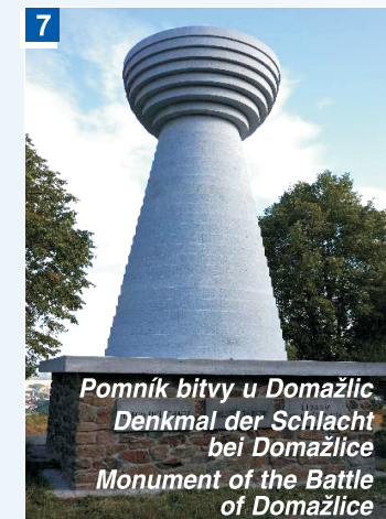
Pomník bitvy u Domažlic Denkmal der Schlacht bei Domažlice Monument of the Battle of Domažlice

7 Baldov Hill (3 km) - an observation point with panoramic map (Czech Tourists' Club), the Chapel of the Holy Trinity. In 2015, a monument of the Battle of Domažlice was unveiled on Baldov it is a 6 m tall chalice by sculptor Václav Fiala.