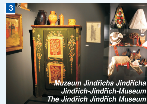
Muzeum Jindřicha Jindřicha Jindřich-Jindřich-Museum The Jindřich Jindřich Museum