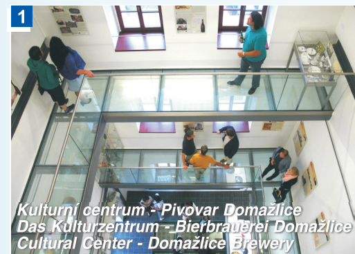
Kulturní centrum - Pivovar Domažlice Das Kulturzentrum - Bierbrauerei Domažlice Cultural Center - Domažlice Brewery

1 Kulturní centrum - Pivovar Domažlice - v nově zrekonstruované části domažlického pivovaru s názvem Hvozd je k vidění expozice o historii pivovarnictví v Domažlicích i v regionu. Jedná se o architektonicky originálně řešený prostor s prosklenými lávkami. Komenského 10, tel. +420 379 725 852, www.idomazlice.cz