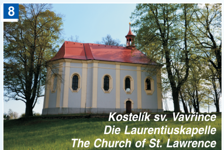
Kostelík sv. Vavřínce Die Laurentiuskapelle The Church of St. Lawrence

7 Hügel Baldov (Baldawa) (550 m N. N.) (3 km) - Aussichtspunkt mit der Panoramakarte, die Allerheiligen-Kapelle An die hussitische Vergangenheit der Stadt Domažlice erinnert das im Jahr 2015 feierlich enthüllte Denkmal der Schlacht bei Domažlice , es handelt sich um einen sechs Meter hohen und zwei Meter breiten Kelch, geschaffen vom Bildhauer Václav Fiala.